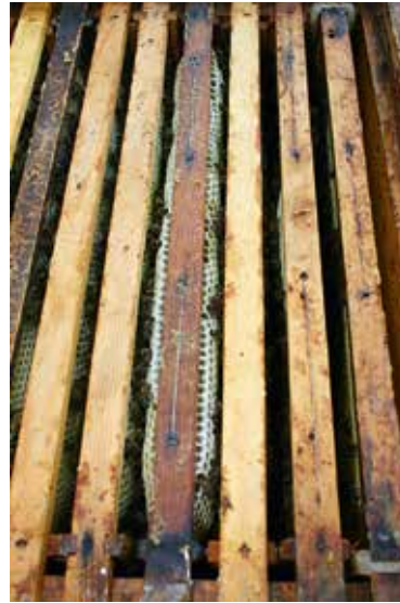
Typische Dickwabenbildung bei der Honigraum Ausstattung nach dem Sandwich System:

Tote Völker gehören nach dem Untersuchen und Forschen nach der Ursache des Ablebens, umgehend