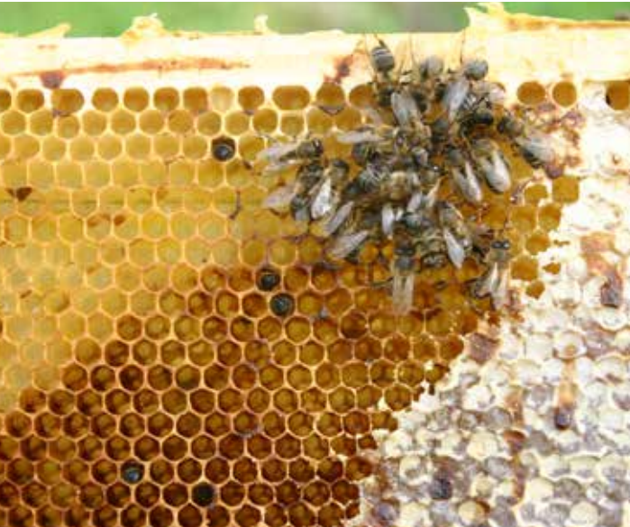
Trauriger Anblick: Tote Bienen und Kotschleim, hier hat ein Kandidat den Winter nicht überlebt.

bei koten sie ab, um schnell Höhe zu gewinnen.