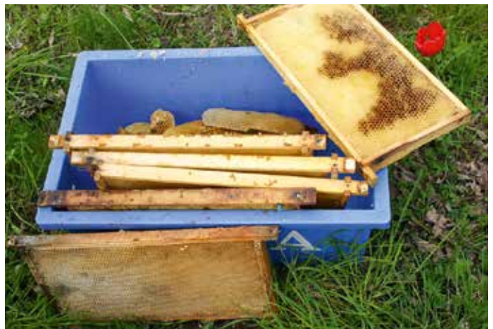
Immer dabei: Restekiste – Wirrbau, Drohnenbau, ausgebrochene Weiselzellen und auszuscheidende Waben werden gesammelt und eingeschmolzen. Vorteil: Keine hartnäckigen Verschmutzungen im Kofferraum