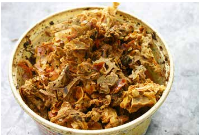
Immer dabei der Kittharztopf, darin sammle ich das gesamte, bei der Völkerbearbeitung anfallende Kittharz. Bei Durchsichten reinigt man durch Abschaben, die Hoffmann Seitenteile seiner Rähmchen, dann ist wieder genügend Platz in der Beute, kein Rahmen klemmt fest.