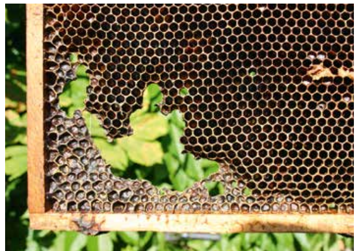
Diese Wabe war im Randbereich des Wintersitzes verschimmelt, der Imker hat sie nicht entnommen. Die Bienen haben sie im Verlauf der Saison abgeschrotet aber nie wieder benutzt. Verschimmelte Waben können Toxine beinhalten.

ausreichendem Raumangebot sehr schnell. Also raus mit den dunklen Waben!