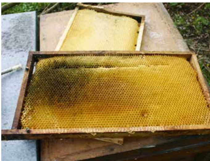
Bei den Völkern entnimmt man schlechte, verschimmelte Waben und ergänzt die Lücke im Bau mit Mittelwänden.

Der Honigraum wird bei mir über dem Absperrgitter aufgesetzt, es wird