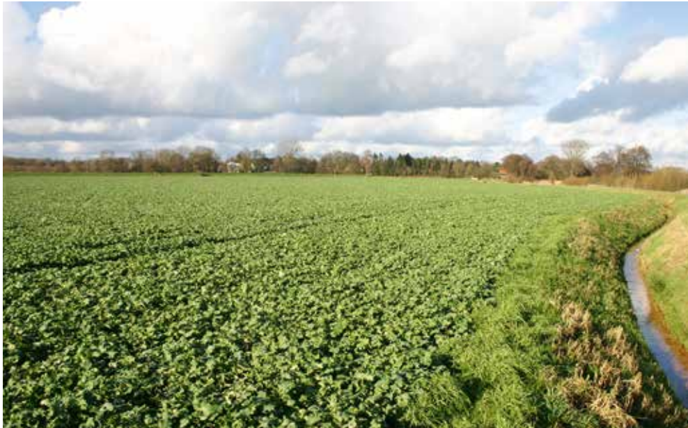
Noch schlummert der Raps, eine der wichtigsten Trachtquellen, die wir (noch) haben.

Verschimmelte und unbesetzte Waben werden entnommen. Das ist gut für die Hygiene und gibt Raum zum Erweitern mit Mittelwänden und Baurahmen.