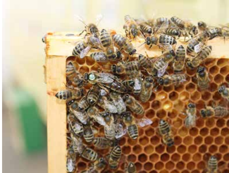
Trifft man die Königin bei einer Volksdurchsicht an, so ist das immer ein schöner Anblick. Fehlt sie komplett im Volk und keine Stifte sind zu sehen, so vereinig man im April das weisellose mit einem weiselrichtigen Volk, über Zeitungspapier. Die Winterbienen sind insgesamt zu alt, dass es noch Sinn macht sie eine Königin nachschaffen zu lassen.

Besonders bei der ersten Völkerrevision, aber auch sonst im Jahr, lässt sich Kittharz ernten. Im Früh-