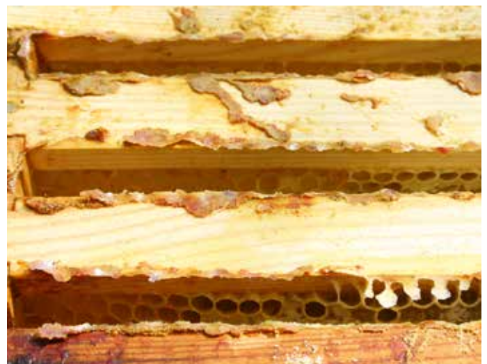
Bei der Völkerbearbeitung im Frühjahr kann man sortenreines Kittharz finden und ernten.