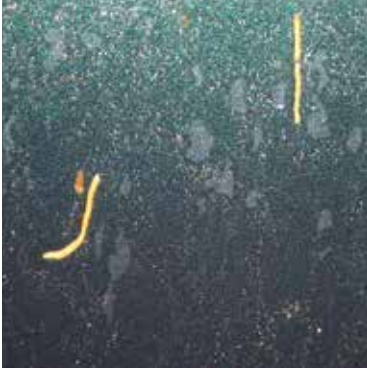
Typischer Würstchenkot bei der Maikrankheit. Krabber und flugunfähige Hüpfen sind die Folge, die Völker werden schwach.

er hat den größten Effekt auf die Reduktion der Milben und hält die Entwicklungskurve der Milben bis in den Herbst flach.