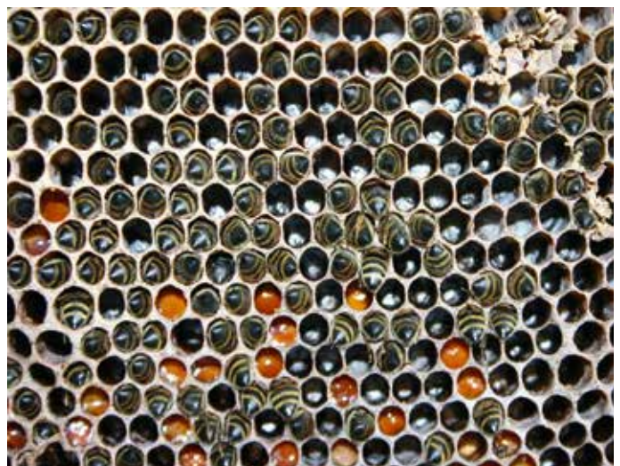
Verhungertes Volk! Typisch ist das mit dem „Kopf in den Zellen“ stecken. Nur die Hinterteile der Bienen sind zu erkennen – Vielleicht ein „letzter Gruß“ an den nachlässigen Imker?