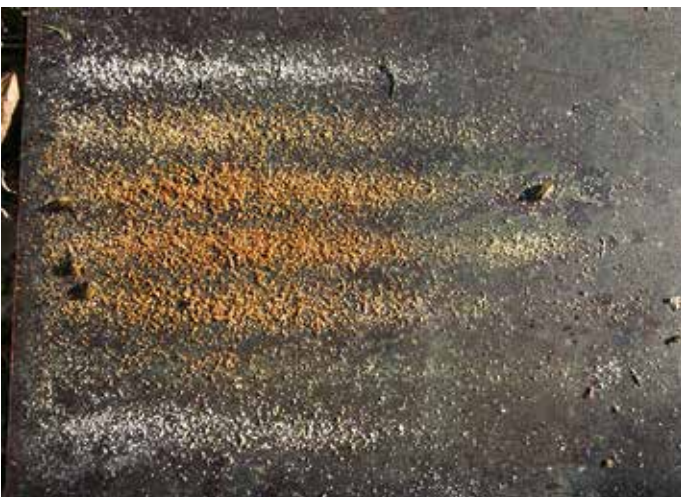
Bodeneinlage: Im April dürfen Sie nicht mehr als eine Milbe/Pro Tag finden, liegen Sie darüber, muss während der gesamten Saison, intensiv Drohnenbau geschnitten werden. Eine Varroazidanwendung hat keinen Erfolg und macht Rückstände im Honig.

spiel eine Regentonne die am Bienenhausdach angeschlossen wird, und mit Schwimmermaterial (Korken, Wasserlinsen) gegen das Ertrinken der Wassersammlerinnen bestückt wird. Die Tränke wird in der Regel gut angenommen und der Imker hat ein erquickendes Gefühl seinen Lieblingen etwas Gutes getan zu haben. Dabei hat er eines nicht beachtet: Bienen haben bei Tagesbeginn oder nach längeren Flugpausen (Regen, kaltes Wetter, starker Wind) die Eigenart nach dem Starten sich in einer spiralförmigen Flugbahn empork zu schrauben, hier-